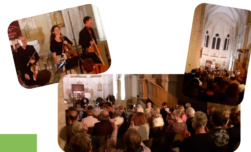
Très beau succès pour le concert du Trio Guersan le 8 septembre à l'église de Beauchery dans le cadre du Festival Inventio