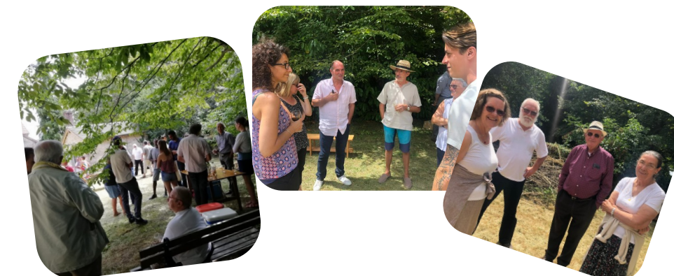
Apéritif du 14 juillet avec un grand nombre de participants qui sont venus profiter du jardin de l'église de Beauchery