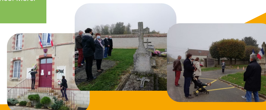
Les Commémorations du 11 novembre ont eu lieu en comité restreint en raison de la situation sanitaire. Un hommage spécial a été rendu au 15 soldats morts au combat au cours de l'année