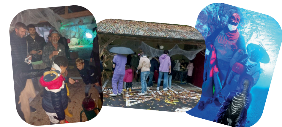
Malgré les intempéries, les enfants et leurs parents étaient nombreux pour la chasse au trésor d'Halloween réalisée en partenariat avec des habitants de Beauchery